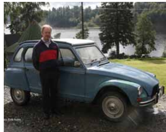
Jan Steen. Dyane, lys blå.